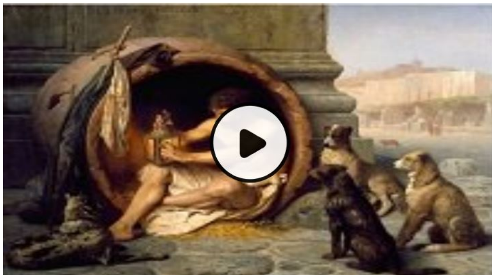
Philosophie et modes de vie ; de Socrate à Pierre Hadot et Michel Foucault (Sciences humaines et sociales, philosophie)