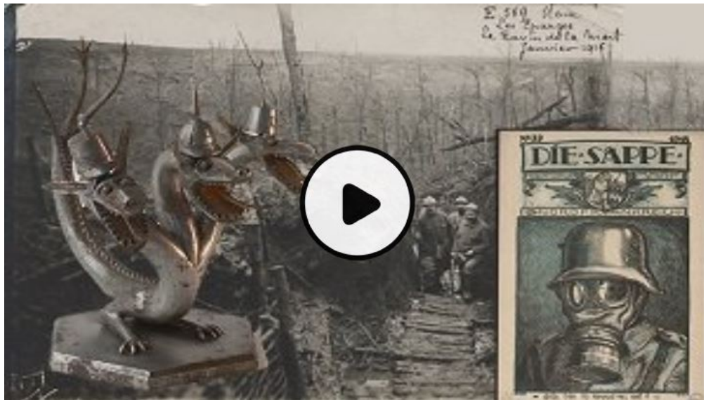
La Première Guerre mondiale expliquée à travers ses archives (Histoire)