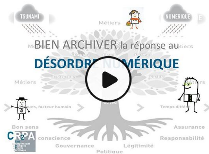
Bien archiver, la réponse au désordre numérique (Numérique, technologie, Vie de l'entreprise)