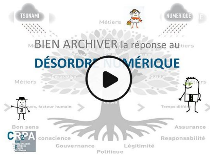
Bien archiver, la réponse au désordre numérique (Numérique, technologie, Vie de l'entreprise)