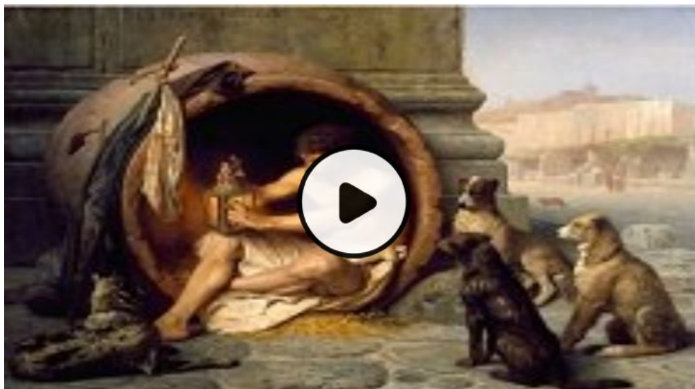
Philosophie et modes de vie ; de Socrate à Pierre Hadot et Michel Foucault (Sciences humaines et sociales, philosophie)